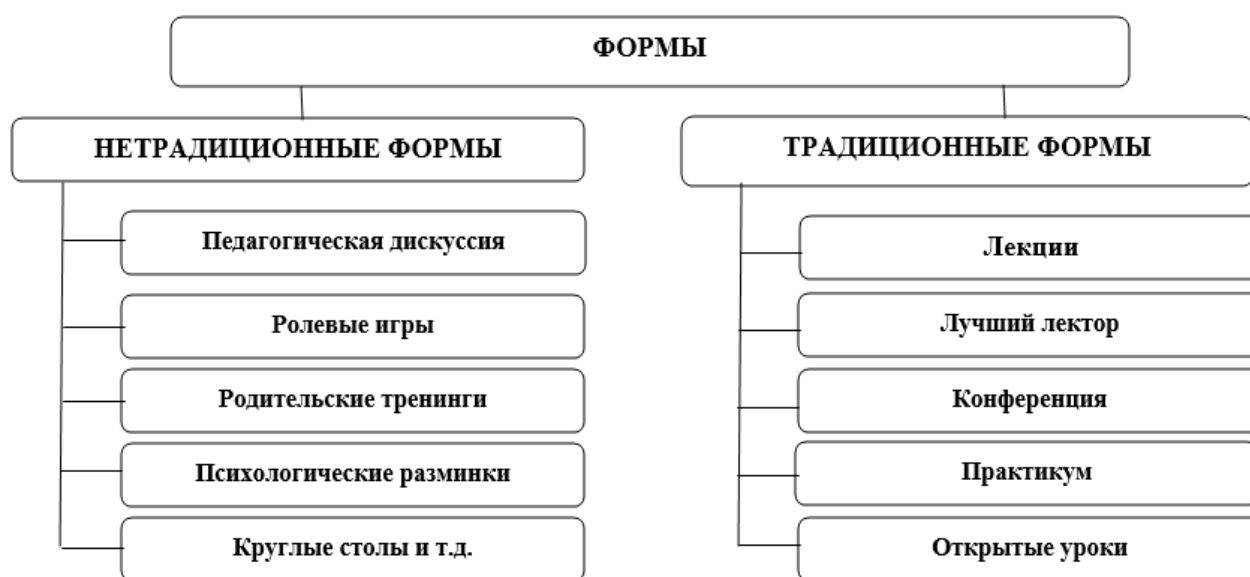
Рисунок 1. Формы работы с родителями

Один из подходов к сотрудничеству между классным руководителем и группой наиболее опытных и активных родителей состоит в организации классного родительского комитета. Под руководством классного руководителя этот комитет совместно разрабатывает и реализует коллективные инициативы в области педагогического образования, поддерживает контакты с родителями, оказывает помощь в воспитании учеников, организует совместные досуговые мероприятия и проводит анализ, оценку и обобщение результатов (рис. 1) [7; 729].