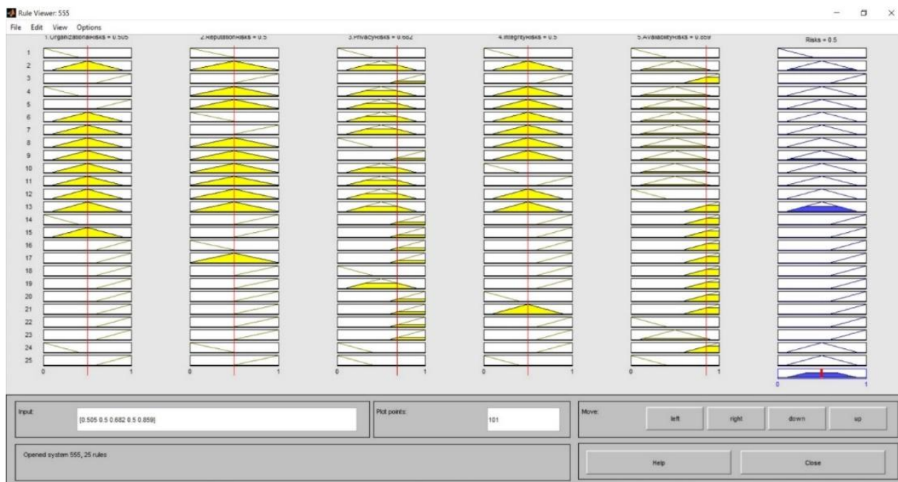
Рисунок 2. Тестовые расчеты fuzzy машин рисков

Нижнее и верхнее значения определяют трапецевидную функцию принадлежности для каждой входной и выходной переменной. Для каждой нечеткой машины использовался центроидный метод дефаззификации. На рисунке 2 приведены результаты испытаний для каждой из пятнадцати нечетких машин. Результат дефаззификации показан синим в правом углу. Для примера использовалась Система управления обучением Platonus v5.2 (build#788) в Esil University http://pl.kuef.kz/ .