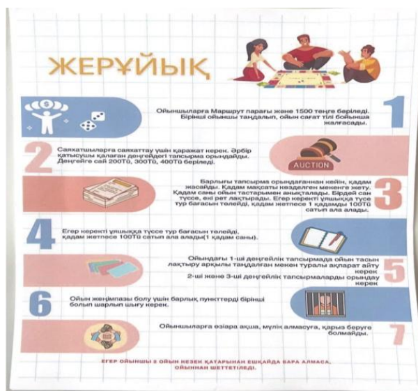
1-сурет. Геймификациялық ойын шарты (Жерұйық)

Ойын барысында топтық жұмыстарды ұйымдастыру арқылы коммуникация дағдыларын дамытуға да ерекше көңіл бөлінді. Білім алушылардың бір-бірімен пікір алмасып, өз ойларын ашық және еркін жеткізуі сабақтың тартымдылығын арттырып, олардың ынтасын оятты. Мұндай оқыту әдісі, бір жағынан, ұлттық педагогиканың негіздерін сақтай отырып, заманауи әдіс-тәсілдерді қолдануға мүмкіндік берді. Сонымен қатар, білім алушыларға ақпаратты тек қана тыңдай отырып емес, оны белсенді түрде өздеріне қажетті формада қолдануға, тәжірибе жүзінде меңгеруге мүмкіндік туды. Осының бәрі оқыту үрдісін қызықты әрі шығармашылыққа толы етті.