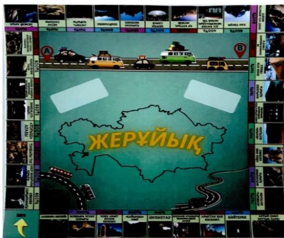
2-сурет. Геймификациялық жерұйық ойынының картасы

Білім алушыларды тек біліммен қаруландырып қана қоймай, олардың жеке дамуында маңызды рөл атқарады, өйткені әрбір дұрыс жауап немесе ұтылған балл келесі тапсырмаға дайындық пен мотивацияны арттырады. Мысалы: Бірінші деңгейден өтуге берілген тапсырма: Ш. Уәлихановтың қазақ жерін зерттеген аймағының карта-схемасын табыңыз. Екінші деңгейден өту тапсырма: карта-схемада көрсетілген нысан атауының ұлттық құндылығы көрсетілген картаны анықтаңыз. Үшінші деңгейден өту тапсырмасы: аталған нысандарды картадан табыңыздар.