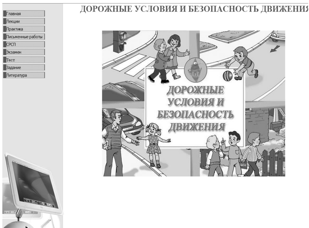
Рисунок. Фрагмент интерфейса электронного учебника «Дорожные условия и безопасность движения»

Структурное построение учебного материала в электронном учебнике отвечает закономерностям учебного процесса и требованиям, предъявляемым к подобного рода электронным учебным изданиям, и включает в себя тексты, задания, проблемные вопросы, обобщающие формулировки и т.п. Все эти элементы взаимосвязаны в учебнике с аппаратом ориентировки, которые присутствуют на экране пособия и доступны на любой его странице.